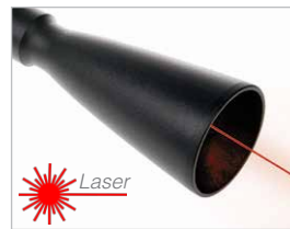
Módulo de largo alcance