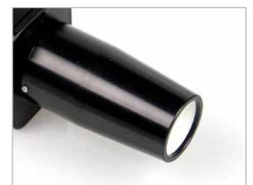
Módulo de enfoque cercano